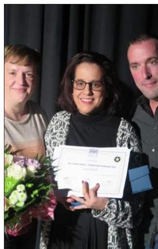
Les gymnastes de l'IME récompensées par le champion international 2018.