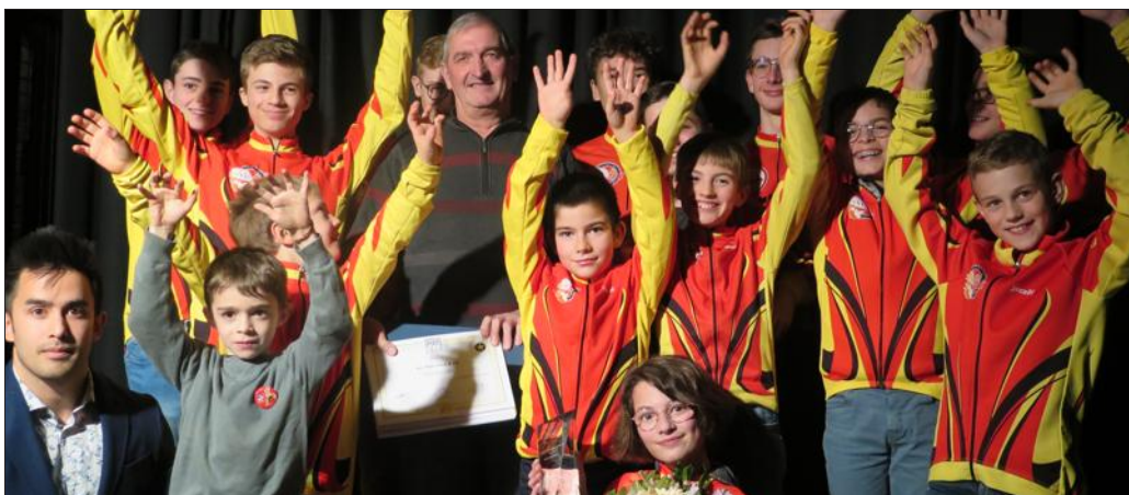
L'équipe sportive de l'année : les jeunes de l'école de l'amicale laïque Toul cyclo et VTT. Trophée remis par Anthony Noël, champion international de breakdance.