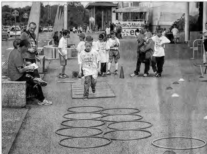
■ Les participants étaient très motivés lors de leurs passages dans les différents ateliers.

Cette année, 11 équipes étaient engagées sur le terrain, l'école de Dommartin, l'AMS football, le FC Toul 1 et 2, l'Espérance Basket, l'US Toul, la Souris verte (Chaudeney-sur-Moselle et le centre Leclerc), le Judo (Gon-