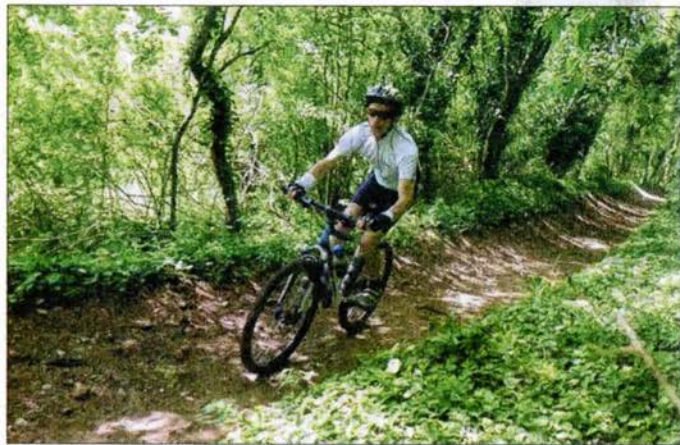
■ Les bois environnants ? Un régal pour tout amateur de VTT !