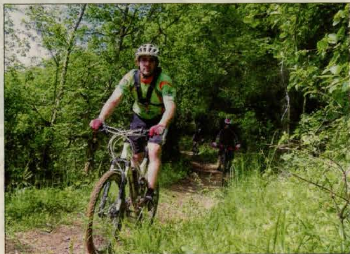
■ Les vététistes se sont régalés, au gré des cinq parcours possibles.

Week-end de l'Ascension, Ascension du Vin gris... mais aussi ascension des côtes de Toul à vélo ou à pied ! C'était avec l'Amicale laïque cyclo, hier matin.